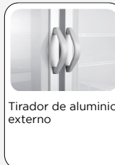
Tirador de aluminio externo