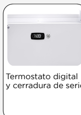
Termostato digital y cerradura de serie