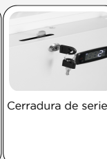
Cerradura de serie